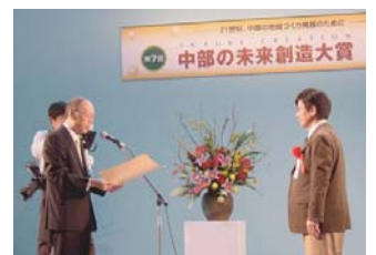
中部の未来創造大賞表彰式にて

【森くらぶの活動を支えていただいた団体・企業】 [敬称略・50音順] … (社)愛知県建築士会・(財)イオングループ環境財団・(財)国際花と緑の博覧会記念協会・(財)都市緑化基金・(社)名古屋市みどりの協会・(財)ニッセイ緑の財団・(財)日本グラウンドワーク協会・日本軽金属(株)・日本財団・(株)ホージュン・リコー中部(株)