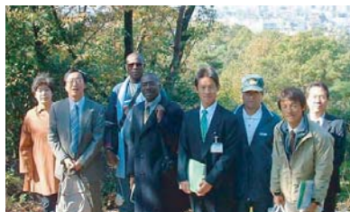
セネガルの視察団と記念撮影