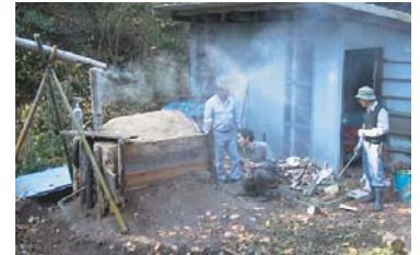
常設窯での竹炭焼き