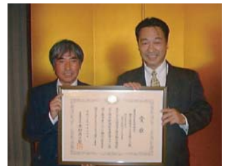
緑の都市賞表彰式にて